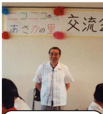
1995・平成7年9月 二本松のニコニコの会との 交流会にて

私が新卒で養護施設に就職し、理事長のもとで働いていた当時、常日頃、「子どもたちにとって必要な大人になりなさい」と繰り返し教えられたことを覚えています。あさかの里の職員となってからは、その言葉を『当事者の人たちにとって必要な・・・』と置き換えて日々過ごしてきました。あさかの里での理事長は、大変あたたかく、いつも「今何か困っていることはないですか」と語られ、利用者や職員のことを常に気にかけて、大きな安心感の中で仕事を進めることができました。