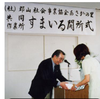
1998・平成10年8月 すまいる開所式にて