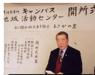
2000・平成12年12月 キャンパス開所式にて