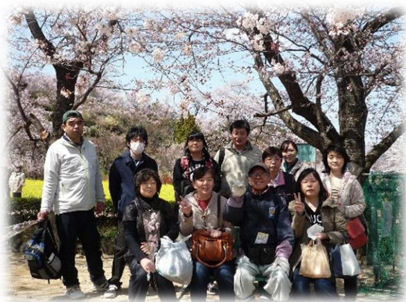
すまいる 福島花見山 4/9 桜が最高・花の香りで別世界