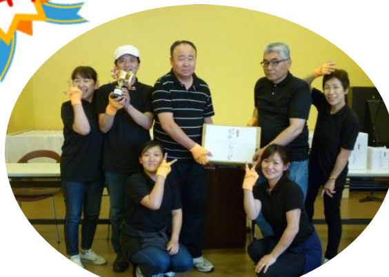
優勝したキャンバスチーム