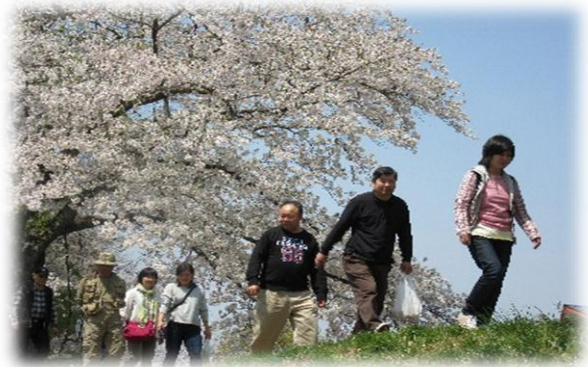
キャンパス 猪苗代 4/28 花も、川もきれいだなあ～