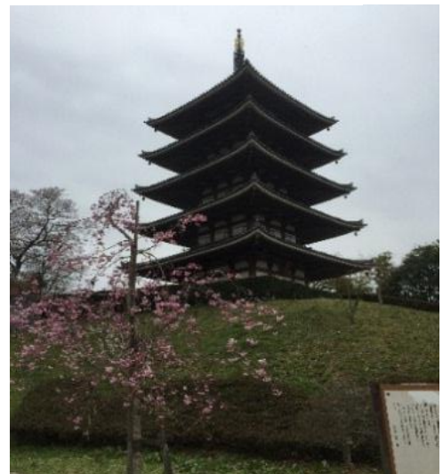
暁紫舎 二本松安達が原 4/13