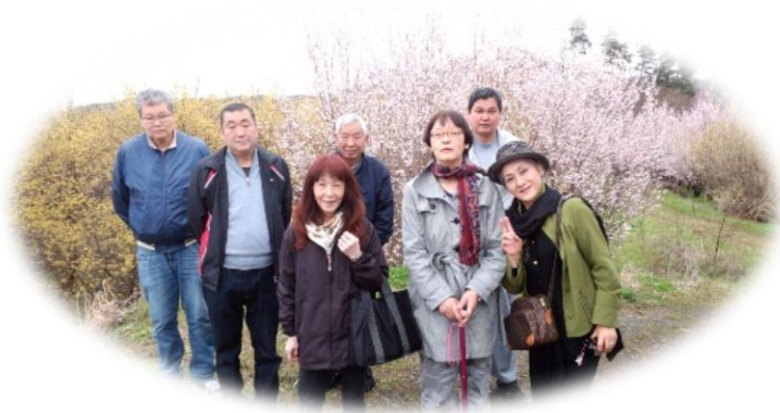
第1 菜の花 三穂田千本桜 4/14 花がいっぱい、見事