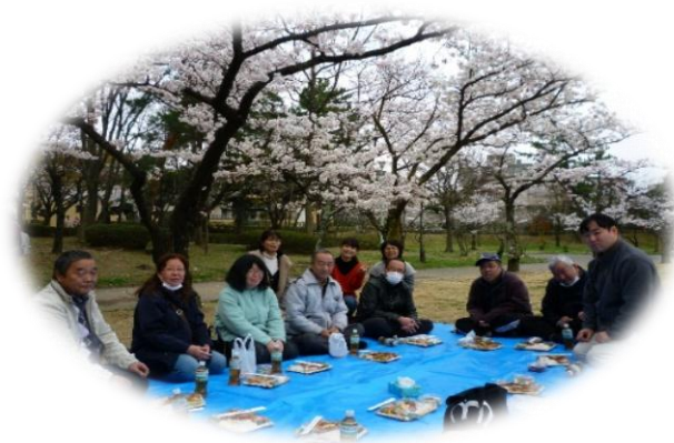
第2 暁紫舎 開成山 4/13 寒かった、途中からの雨で残念…